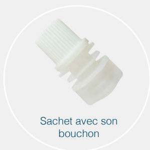
Sachet avec son bouchon

Effytec : c'est un constructeur d'ensacheuses horizontales FFS. Pour la réalisation de sachets Doypacks ou à plat.