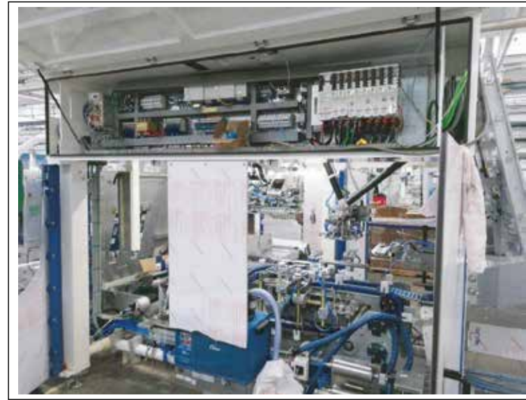
Vue générale carters ouverts